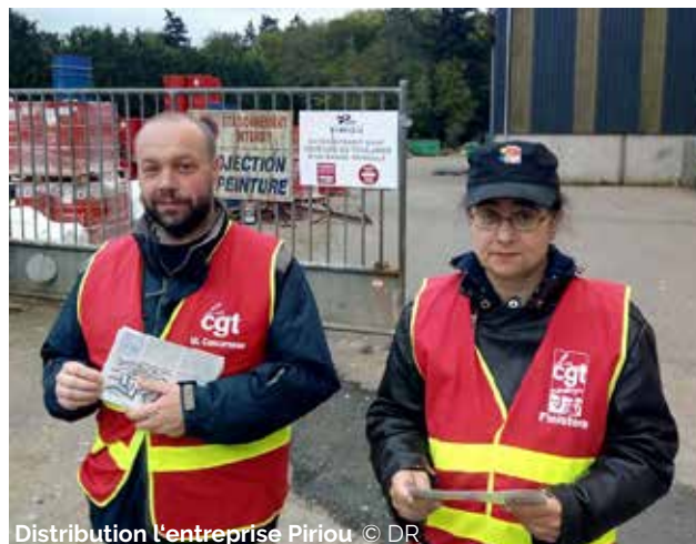
Distribution l'entreprise Piriou

Si le premier coup d'envoi a été donné le 6 mars dernier, plusieurs initiatives ont eu lieu depuis en collaboration avec l'interpro. Au départ, les salariés ont parfois été un peu méfiants, mais globalement, l'accueil est plutôt chaleureux. Premier signe d'encouragement, après chaque distribution de tracts, la page Facebook connaît un pic de visites. Et quatre adhésions ont été réalisées, sur plusieurs sites, depuis la mise en place du plan de déploiement. C'est autant de points d'appuis supplémentaires pour la suite. En parallèle de ce plan de déploiement, les métaux bretons ont décidé d'aller négocier un maximum de protocoles d'accord préélectorales dans les entreprises de la branche où la CGT n'était pas implantée. Ainsi, un premier travail a été réalisé et un tract a été