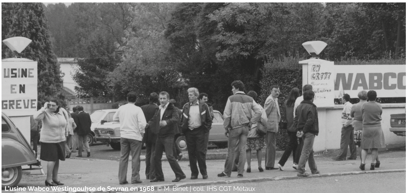
L'usine Wabco Westinghouse de Sevrans en 1968

La Fédération CGT des métaux sort renforcée des grèves, avec plus de 100 000 adhésions et 600 bases nouvelles. Ces succès sont autant