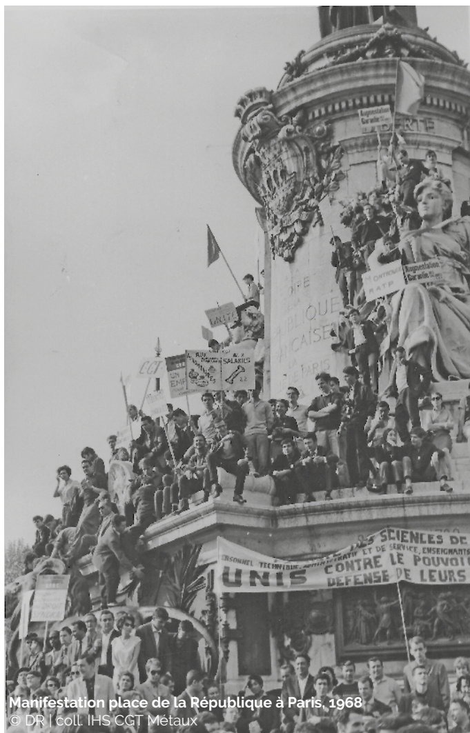
Manifestation place de la République à Paris, 1968

Le 24 mai, au soir, de violents affrontements secouent Paris, Nantes et Lyon. De Gaulle annonce alors la tenue d'un référendum en juin et d'une négociation tripartite. Cette dernière s'ouvre le 25 mai au ministère du Travail, rue de Grenelle. Les discussions sont âpres, seul un « constat » peut être dressé le 27 mai au matin. Il prévoit une hausse de 35 % du salaire minimum, qui sera désormais le même partout en France, une hausse de 10 % des salaires réels, la réduction du