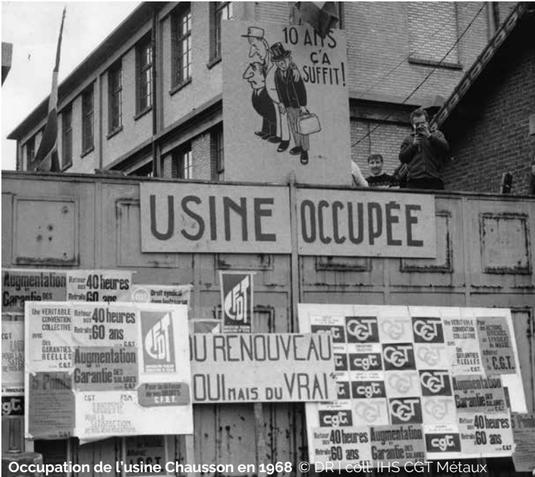
Occupation de l'usine Chausson en 1968

P our bien appréhender ce puissant mouvement social, on doit se placer dans le temps long. Car si l'événement a des bornes chronologiques bien établies, il plonge ses racines sur plusieurs années, tandis que ses effets se déploient jusqu'à nos jours. Cela suppose aussi de saisir les différentes dimensions – sociale, économique, culturelle – de ce printemps inédit et d'envisager la pluralité de ses acteurs.