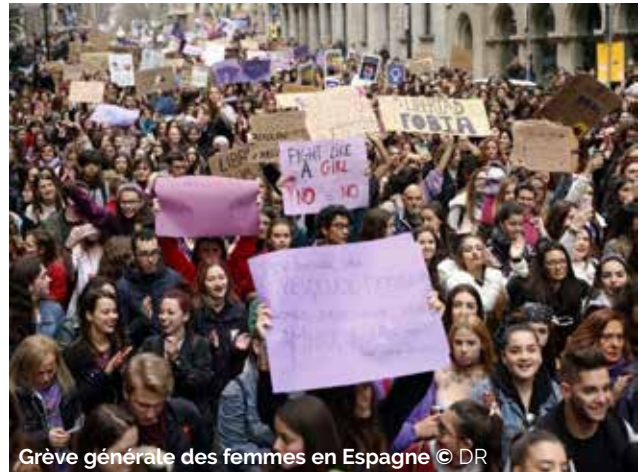
Grève générale des femmes en Espagne

En Espagne, l'écart salarial entre hommes et femmes est de 23% ; 75% des postes à temps partiels sont occupés par des femmes et les compléments salariaux sont 44% plus élevés pour les hommes. Au final, les organisations syndicales UGT et CCOO ont été dépassées par l'étendue de la participation à la grève puisque plus de 6 millions de travailleurs, soit un tiers de la population ac-