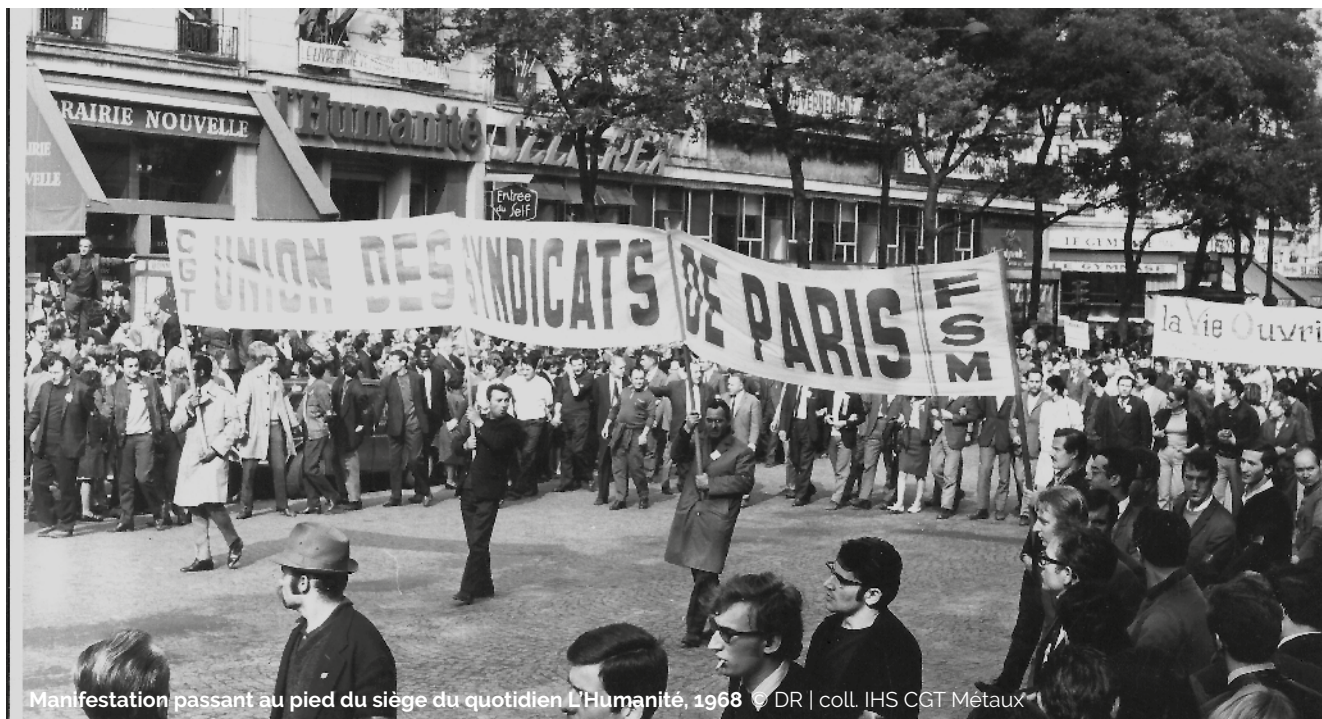
Manifestation passant au pied du siège du quotidien L'Humanité, 1968

de points d'appuis dans les négociations qui se reprennent avec l'UIMM en septembre et qui aboutissent à cinq accords nationaux et à la convention collective nationale des ingénieurs et cadres en mars 1972. L'unité acquise sur le plan syndical se poursuit, non sans difficultés, tandis qu'au plan politique, un programme commun de la gauche est signé en 1972 entre parti communiste, parti socialiste et radicaux de gauche.