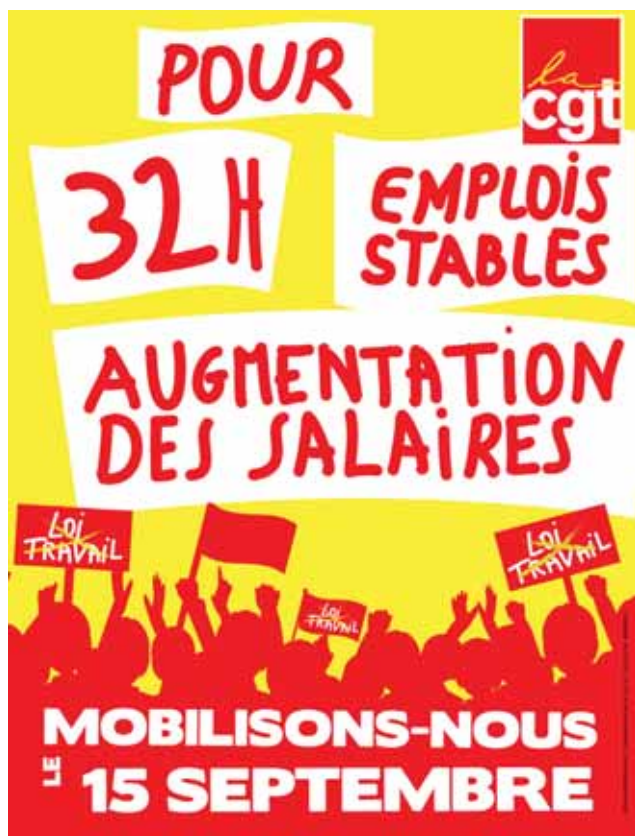
Affiche confédérale appelant à la manifestation

Le plus récent est celui du contrat première embauche (CPE), retiré le 10 avril 2006, soit deux mois après son adoption par le Parlement. Le gouvernement de Villepin, dû reculer face à l'ampleur des mobilisations des jeunes et des travailleurs : quatre journées totalisèrent ainsi plus d'un million de personnes dans les rues, alors que les occupations des lieux d'études et les actions coup de poings ne faiblissaient pas.